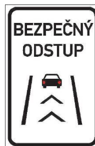
Obrázek 2: Platné dopravní značení dle přílohy č. 5 vyhlášky č. 294/2015 Sb.

Příklady dalších opatření a jejich vliv na dopravní nehodovost budou představeny v prezentaci.