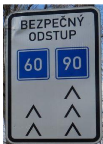
Obrázek 1: Realizované dopravní značení před účinností vyhlášky č. 294/2015 Sb.