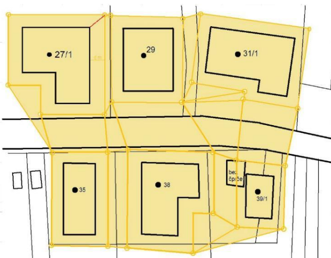
Obrázek 3 Spojnice půdorysů budov

b) mezi jednotlivými budovami, jejichž půdorys se pro tyto účely zvětší po celém obvodu o 5 m, nebude spojnice delší než 75 m. Spojnice tvoří rohy zvětšeného půdorysu jednotlivých budov (u oblouků se použijí tečny). Spojnice mezi zvětšenými půdorysy budov, spolu se stranami upravených půdorysů budov, tvoří souvisle zastavěné území obce.